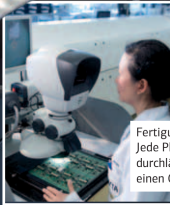
Fertigung: Jede Platine durchläuft einen Check.