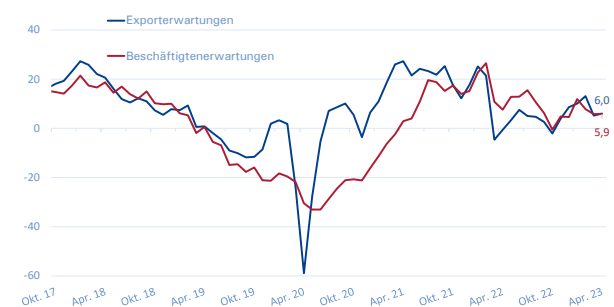
Export- und Beschäftigterwartungen METALL NRW