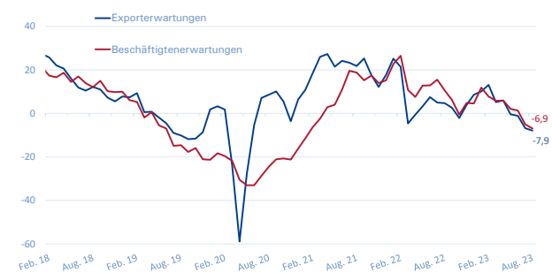
Export- und Beschäftigterwartungen METALL NRW