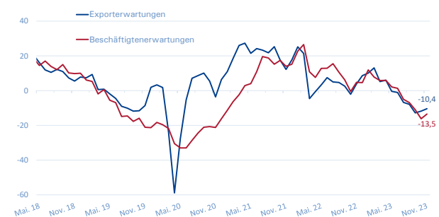
Export- und Beschäftigterwartungen METALL NRW